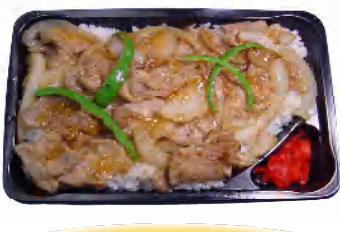
豚しょうが焼き重 税込486円