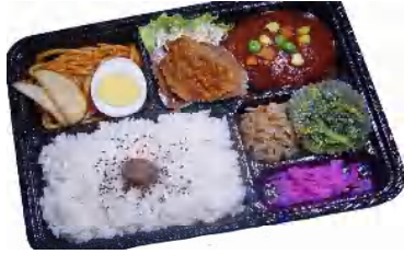
ハンバーグ & 唐揚げ弁当 税込515円

※各種ごはん大盛りは税込62円増し、但しメニューによりごはん大盛りに出来ないものや価格が違う場合がございます。 ※季節・仕入れ等により内容が異なる場合があります。 ※掲載商品を取り扱っていない場合もございます。