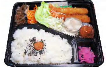
エビフライ弁当 税込515円