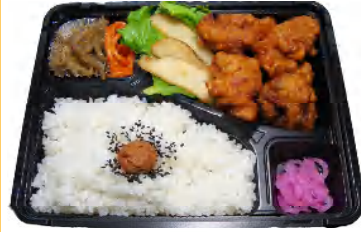
唐揚げ弁当 税込550円