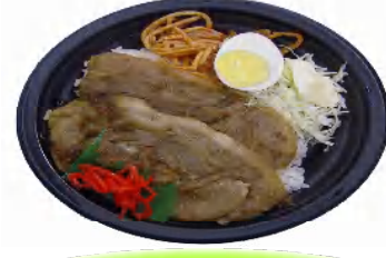
トントン焼き 税込486円