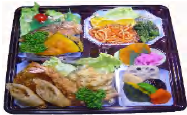
1000円弁当【ライス付きです】 税込1080円