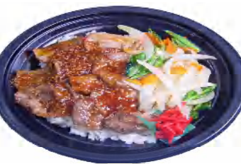
旨みカルビ重 税込606円