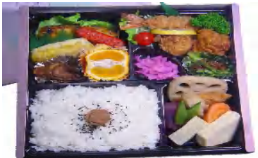
月の砂漠(つきのさばく) 税込1000円