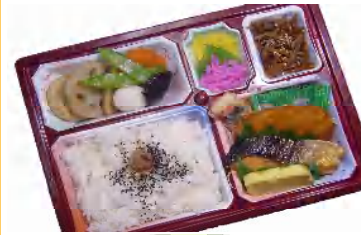
幕の内弁当 税込594円