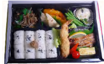
祇園(ぎおん) 税込750円