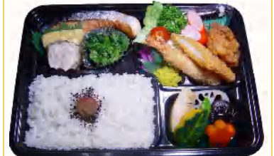
上幕の内弁当 税込918円