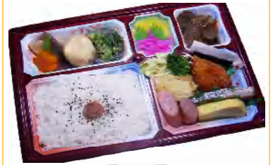
スペシャル幕の内 617円