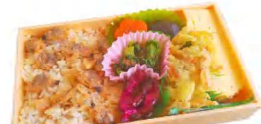
2月27日～5月9日までの 期間限定販売 あさり弁当 税込630円