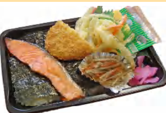
のりさけ弁当 税込390円