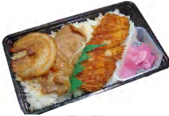
としまやミックス弁当 税込650円