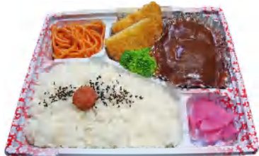
ハンバーグ弁当 税込679円