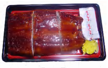
ふっくら特撰うな重 お休み中