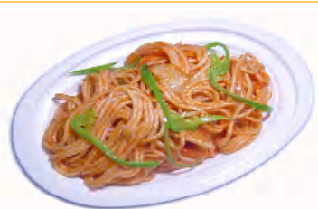
スパゲティー 税込360円