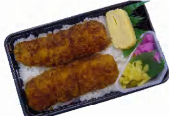
イカフライ弁当 税込600円