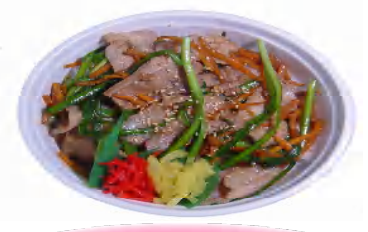
スタミナ丼 税込496円