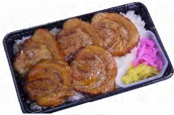
チャーシュー弁当 税込720円