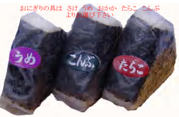
おにぎり(1個) 税込113円