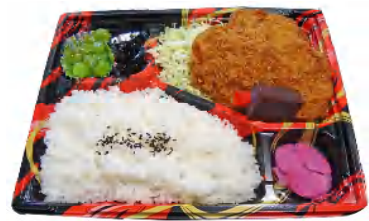
ひれかつ弁当 税込597円