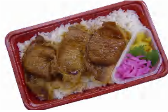
バーベキュー弁当 税込600円