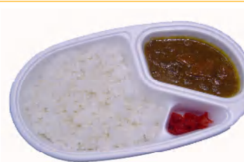
カレーライス 税込442円