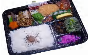
お好みとりあわせ弁当 税込515円