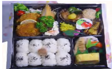
見返り美人(みかえりびじん) 税込980円