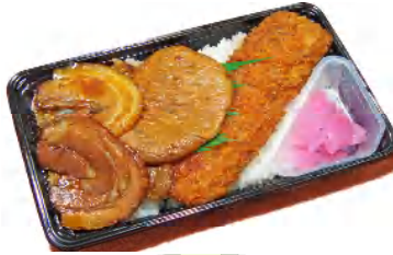
としまやゴージャス弁当 税込760円