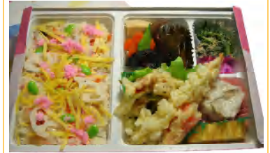
おおだやま 税込670円