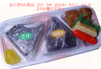
おむすびコロコロ 税込370円