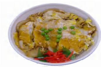
ジャンボカツ丼 税込626円