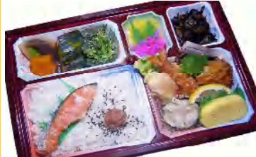
グルメランチ 税込720円