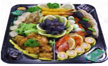
オードブル 税込3240円~