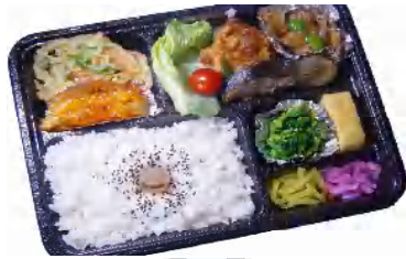
たっぷり幕の内 税込540円